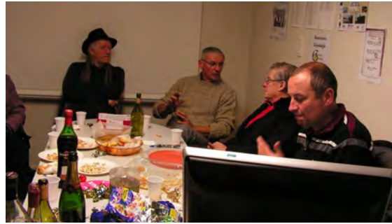
Le « brain trust »

On pense déjà à la date de la prochaine séance en 2015!