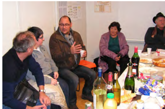
Et les participants