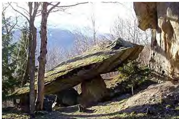
Le Dolmen du Thyl

Voir le bulletin de réservation en fin du journal.