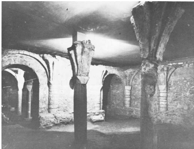
La salle carrée

La crypte se compose de deux salles, une première salle carrée de 7mètres sur 7mètres, puis une « grande salle » de 13mètres sur 7. Toutes deux sont abondamment pourvues de colonnes, de sculptures et des graffiti qui nous racontent l'histoire de cette église primitive.