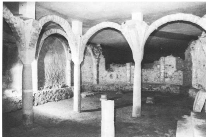
La grande Salle

Il est impossible de dater avec exactitude la construction de la crypte, d'autant que plusieurs hypothèses sont en présence, la plus probable étant que celle-ci fut le résultat de plusieurs constructions superposées au cours des siècles. On a supposé un lieu de culte païen de la préhistoire jusqu'au Xème siècle et des destructions dues aux Sarrazins vers 906, 912 et 935. A la lumière des déblaiements, on a pu constater que la crypte était à l'origine seulement enterrée de quatre marches et que des fenêtres perçaient ses murs. Elle a une longueur de 23 mètres, une largeur de 7 mètres et des murs de 1 mètre10 à 1mètre50.