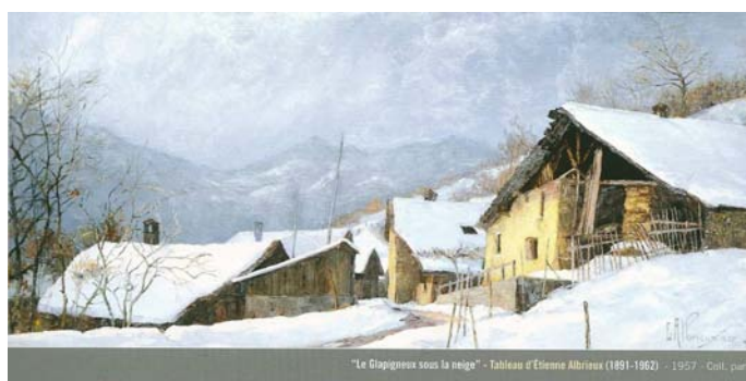
« Le Glapigneux sous la neige » d'Etienne Albrieux