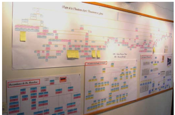
Arbre des Rapin de La Chaudanne et quelques branches nobles de sa descendance