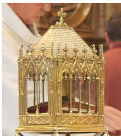
Reliquaire contenant les doigts de St Jean Baptiste