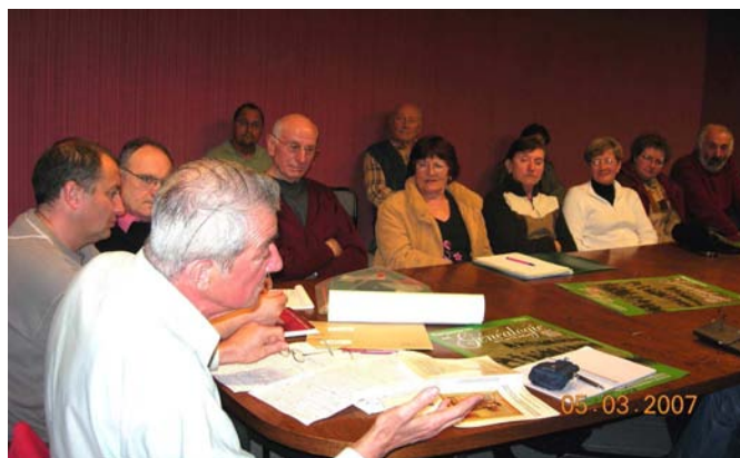
Tous attentifs à l'écoute de l'aventure des premiers colporteurs, ou des exploits des contrebandiers

- Dépouillements : il a reçu plus de 75 000 actes naissances, mariages ou décès, qu'il met en forme pour être prochainement consultables (local, généababank, recueils papier)