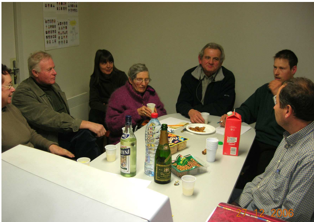
La dernière réunion 2006 fut particulièrement appréciée. .