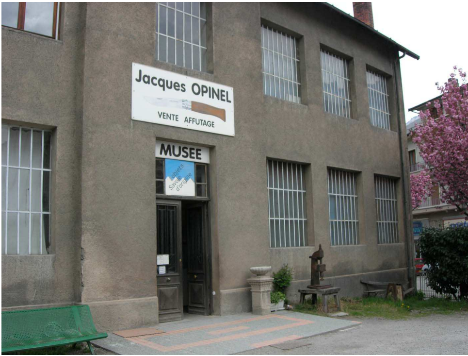
L'entrée du musée OPINEL