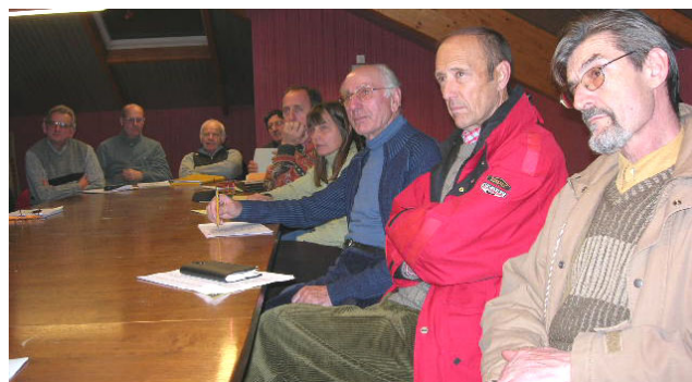
Un public très attentif