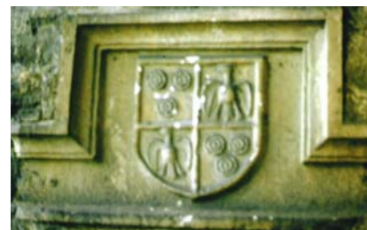
Blason de la Maison Blanche