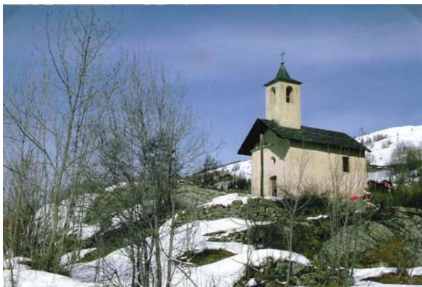
La chapelle de Ste Thècle actuellement

En face de ce manoir, les RAPIN élevèrent une chapelle, trois fois reconstruite, car ils se faisaient Gloire et Honneur d'être de la même race que Sainte THECLE