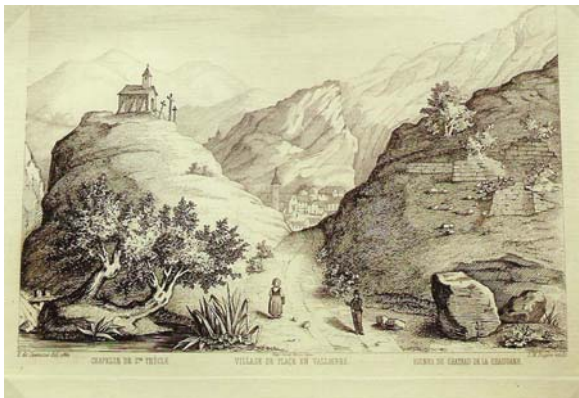
Valloire - Chapelle de Ste Thècle - le Village Ruines du Château de la Chaudanne

La légende de Sainte THECLE est intimement liée à l'histoire des RAPIN de la CHAUDANNE