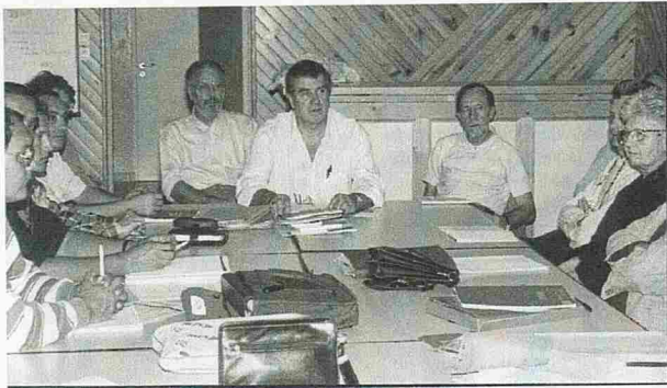
Nos réunions des 1er et 3ème lundi de chaque mois