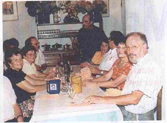
Un moment toujours fort apprécié ...