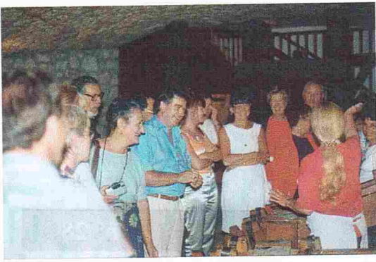
Visite du Vieux Chambéry et du Moulin de la Tourne