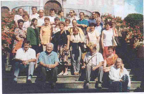
Sortie à Conflans